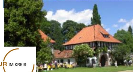
KULTUR IM KREIS