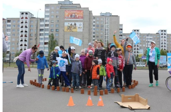
Первый инклюзивный велопробег «Вместе»