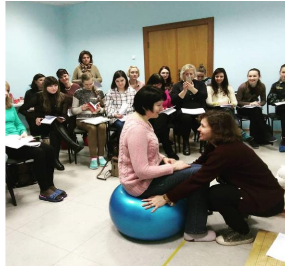
Обучающие семинары для родителей и специалистов