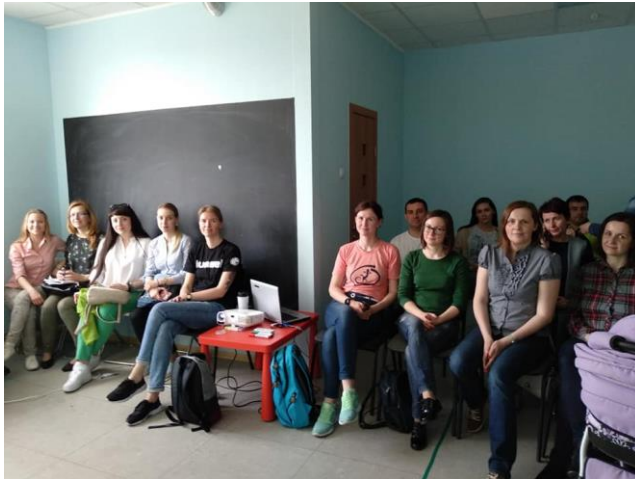
психологическая поддержка семей и работа родительского клуба