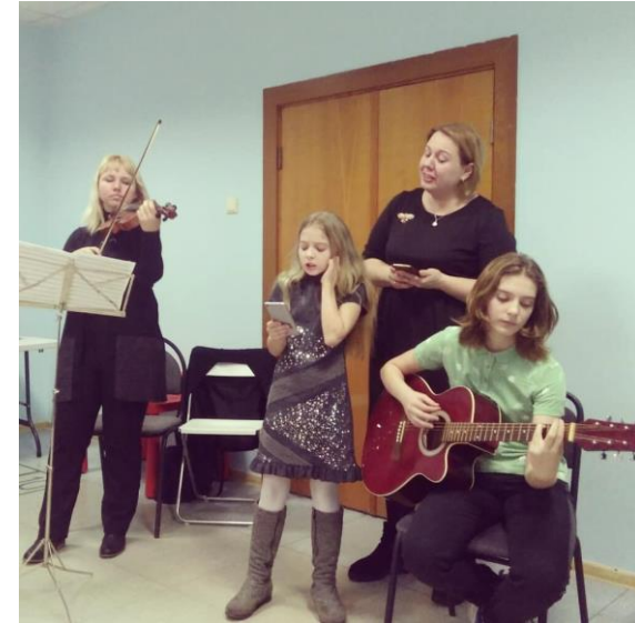
Европейский день музтерапии в «Авокадо»