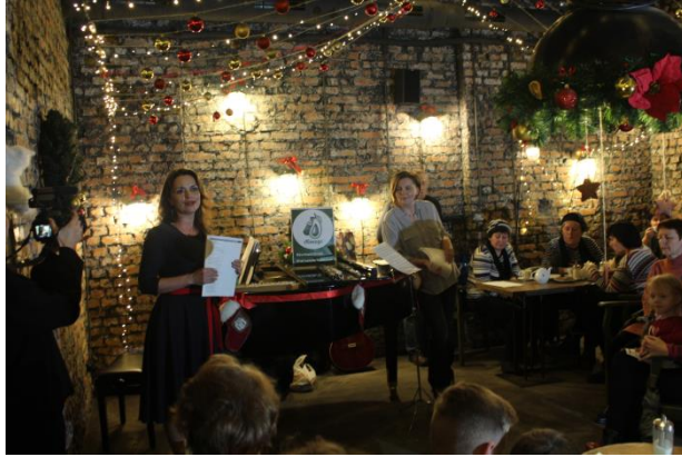
Проект «Петь может каждый»