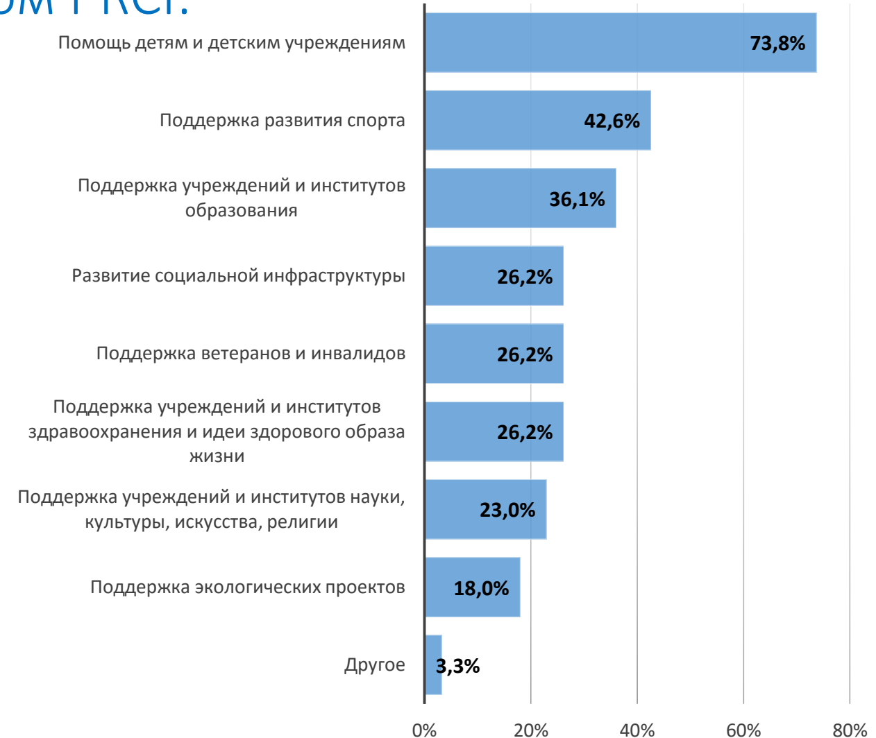
Сферы реализации КСО-проектов, в % от количества реализующих КСО-проекты компаний