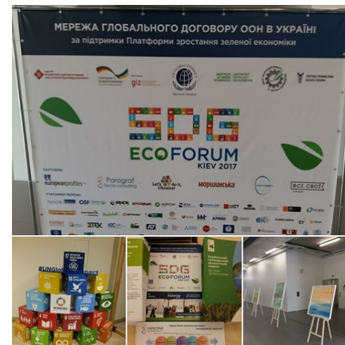
SDG ECO FORUM

12 представителей ЖКХ получили сертификаты МОН и ЕС по энергоменеджменту